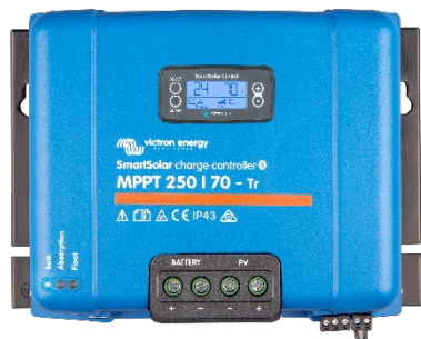
Contrôleur de charge SmartSolar MPPT 250/70-Tr avec un écran enfichable en option