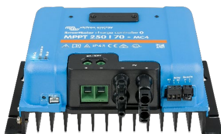
Contrôleur de charge SmartSolar MPPT 250/70 MC4 sans écran