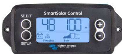
Écran enfichable SmartSolar