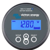
Détection Bluetooth : BMV-712 Smart Battery Monitor