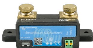
Détection Bluetooth : SmartShunt